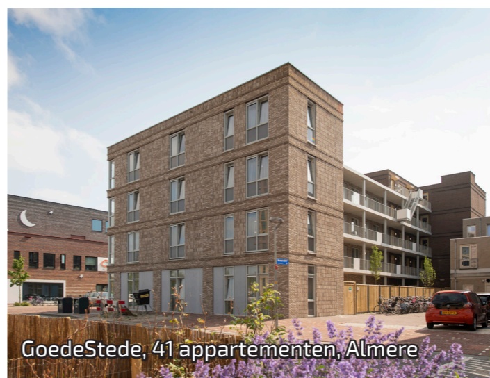
GoedeStede, 41 appartementen, Almere