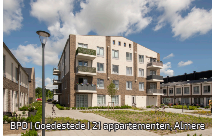
BPD | Goedestede | 21 appartementen, Almere