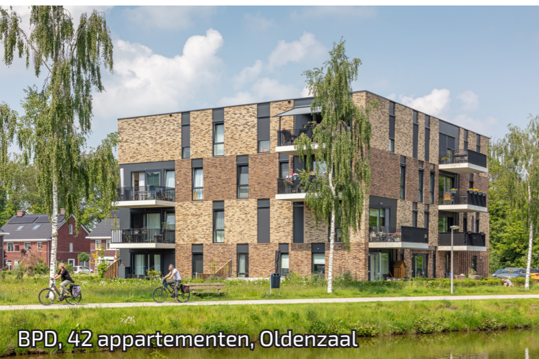
BPD, 42 appartementen, Oldenzaal