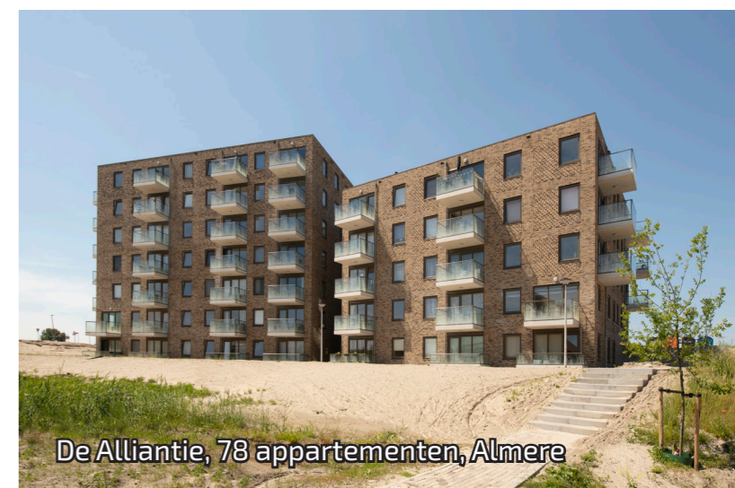
De Alliantie, 78 appartementen, Almere