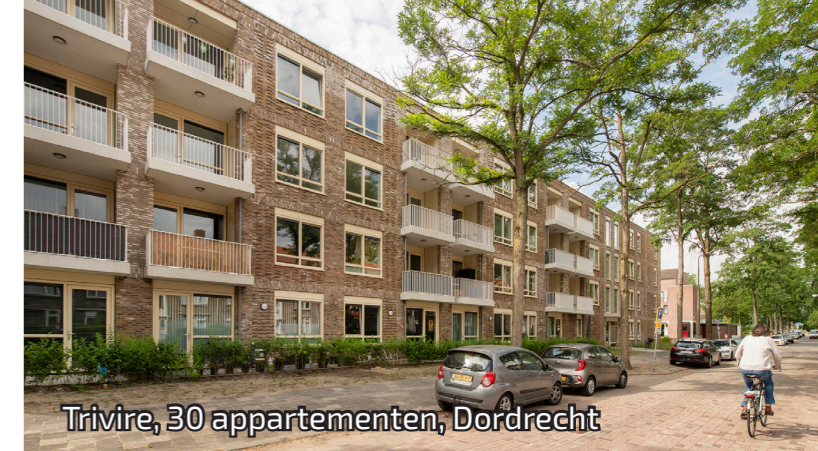
Trivire, 30 appartementen, Dordrecht