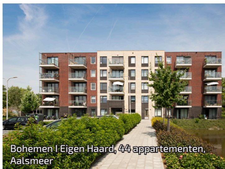
Bohemen | Eigen Haard, 44 appartementen, Aalsmeer

"Trebbe is een familiebedrijf waarmee wij al jaren zaken doen. Kennis van zaken, ondernemerschap en de lange termijn relatie staan hierbij centraal. Deze waarden en de cultuur binnen Trebbe maken het bedrijf bij ons tot een partner die breed in de organisatie gedragen wordt."