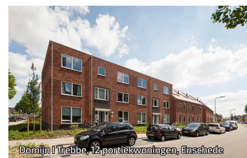
Domijn | Trebbe, 12 portiekwoningen, Enschede