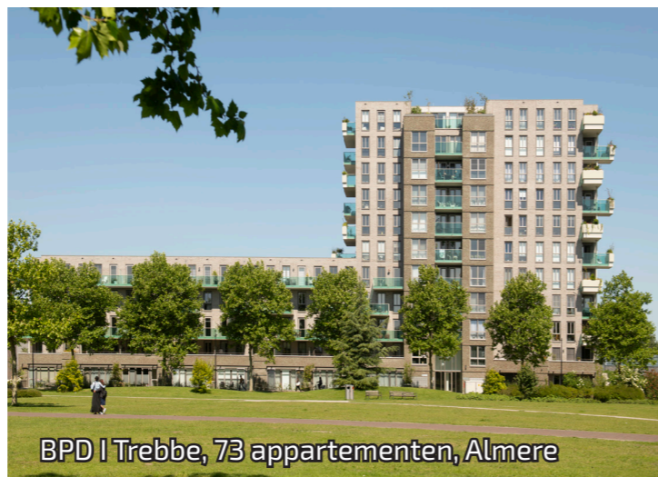
BPD | Trebbe, 73 appartementen, Almere