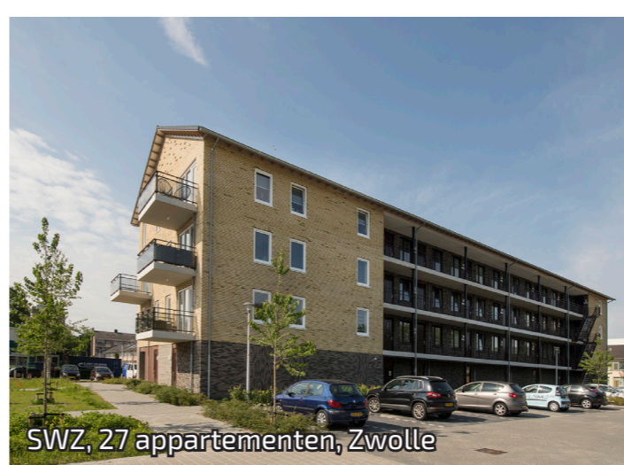
SWZ, 27 appartementen, Zwolle